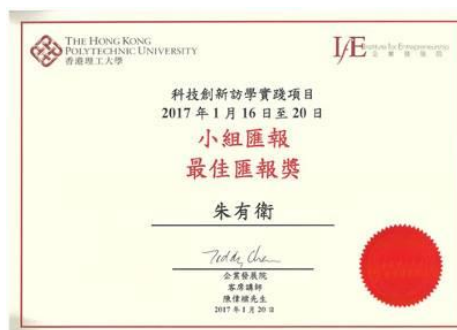
香港理工大学最佳小组证明

在项目最后一天全班进行创新设计比赛，以小组为单位进行方案展示和答辩，香港理工大学主办学院领导向最佳小组所有成员颁发《最佳小组证明》（上图右）。