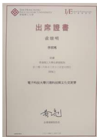
香港理工大学结业证书