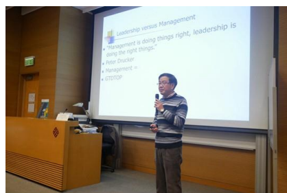
香港理工大学课程