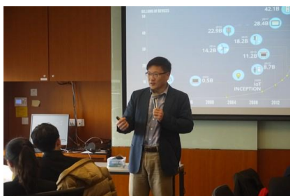
香港理工大学课程