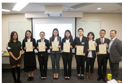
颁发企业结业证书