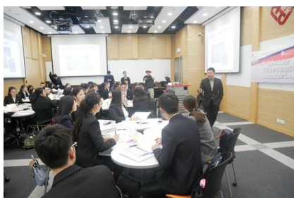
香港理工大学课程

截至 2019 年 2 月，我方已与香港理工大学合作举办了 67 期交流项目，参与学员共计 2500 人。国内定制学校包括：电子科技大学、重庆大学、江南大学、南昌大学、郑州大学、华中农业大学等；