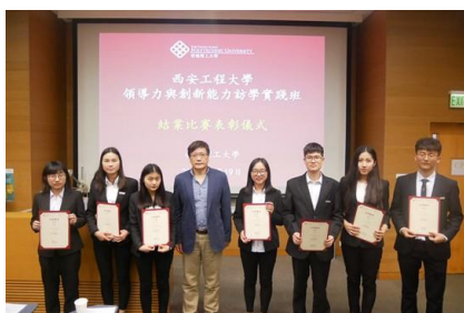
颁发大学结业证书